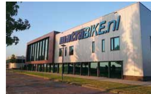
Matrabike Experience Center Waalwijk (NL)

Antwerpsestraat 83, 2840 Reet (gemeente Rumst), België. Tel. +32 38880990